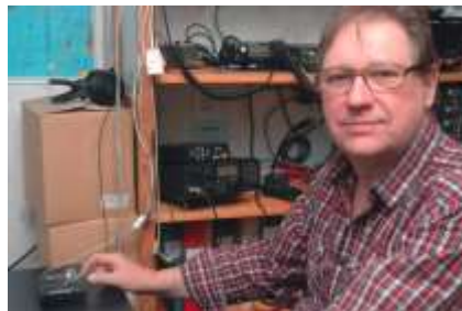
SM7KSZ Sune

fram till ett T-certifikat. En grupp i klubben började träna telegrafi och Sune hängde på. Det var ett A-certifikat som hägrade och då behövdes ett godkänt telegrafiprov i 80-takt och efter några år lyckades han klara av det provet.